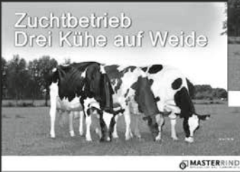
Zuchtbetrieb Drei Kühe auf Weide