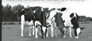
Zuchtbetrieb Drei Kühe auf Weide