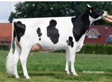
2.M. MAR Illusion GP-84