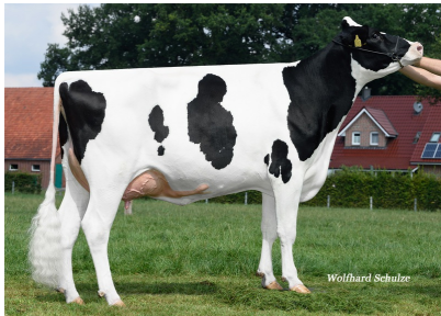
6.M: MAR Illusion GP-84

PP* | ET | \beta -Kn A2/A2 | K-Kn BB | aAa -