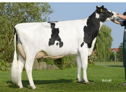
5.M. KHE India VG-88