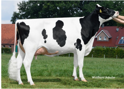
6.M: MAR Illusion GP-84