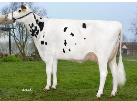
4.M. KHE Israel VG-88