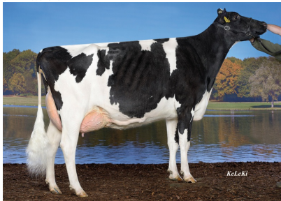
6.M: KHE Illusion VG-88