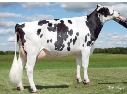
7.M. Scully Shottle May-TW EX-91