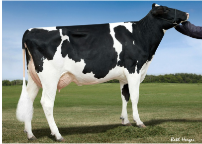
Vollschwester zur 6.M: De-Su 520 EX-90

pp | ET | \beta -Kn A2/A2 | K-Kn AB | aAa -