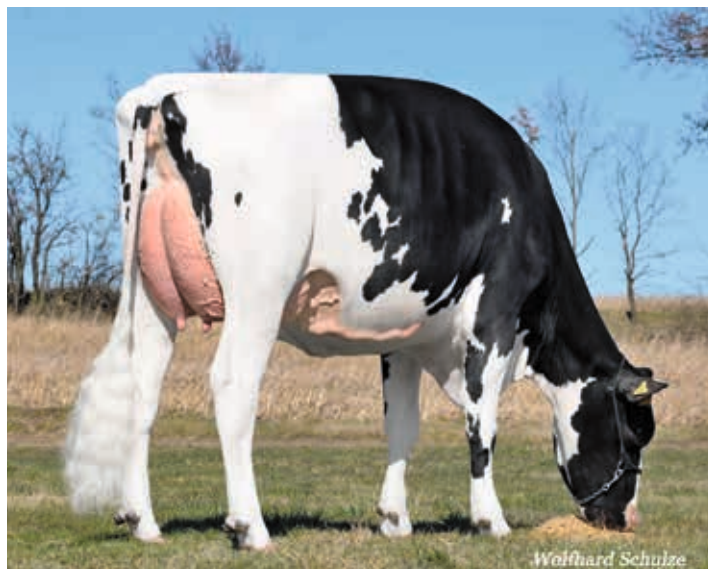
Mariella VG-86 (Mutter v. Supporter 10.833490) Bes.: Agrargenossenschaft e.G. Dobra, Thiendorf