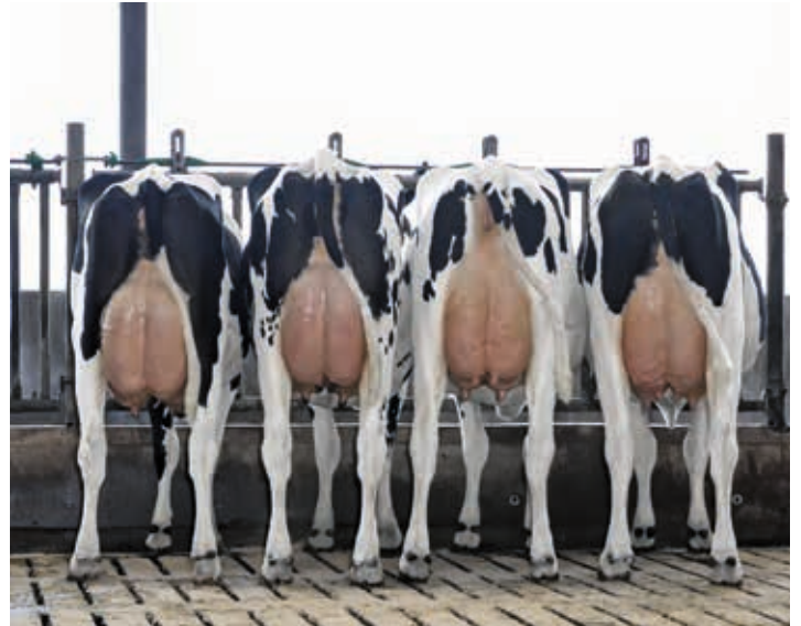
Ballman Töchtergruppe Bes: Kasper agro, Dalfsen (Niederlande)

Neu im Angebot ist der Bulle Revaux PP . Er ist ein VH Alfons P - Sohn, welcher wiederum ein Adagio Nachkomme ist. Weiter geht sein Pedigree über Brilliance und den MASTERRIND Vererber Bestboss, was sein Pedigree für die Hornloszucht einzigartig macht. Revaux PP vererbt wenig Größe bei viel Stärke und Breite. Dazu kommen fest aufgehängte Euter mit starkem Zentralband und längeren Strichen. Ein weiterer homozygot hornloser Bulle von Innoval aus Frankreich ist Renault PP . Dieser Spross der Wapa Bootmaker Mandy EX-96-Kuhfamilie zeigt bei gemäßiger Milchmengenvererbung ein perfektes Linear. Dieser junge Luster-P-Sohn weiß absolut zu gefallen. Darüber hinaus ist er Träger der Beta-Kasein Variante A2/A2. Insgesamt sind es vier neue Vererber unseres Kooperationspartners Innoval, die das Angebot der MASTERRIND ergänzen werden. Auch Sancos PP konnte sich mit dieser