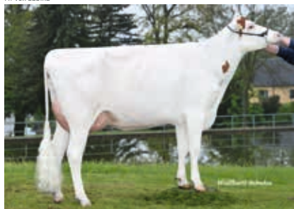
GM: Vox Sophia