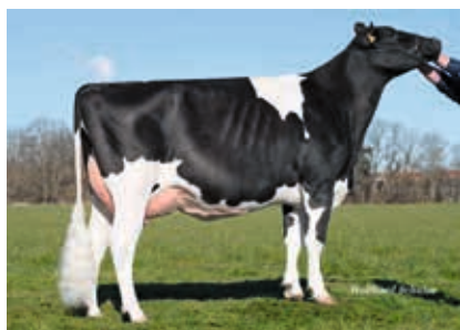
M: SHA Oryx

pp | ET | B-Kn A2/A2 | K-Kn BB | aAa 342