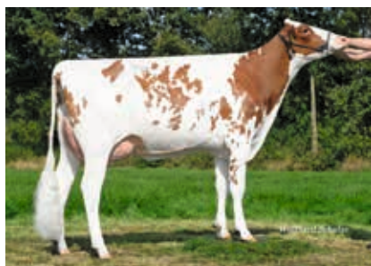
Robika P GP-84

pp | ET | β-Kn A1/A1 | K-Kn BB | aAa 243