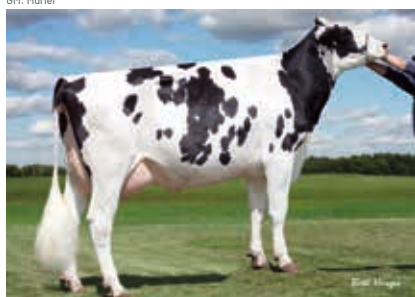
6. M: Sully Shottle May-TW EX-91