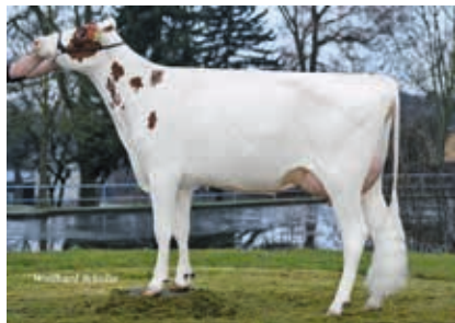
GM: Vox Sabina

PP* | ET | \beta -Kn A2B | K-Kn BB | aAa 234