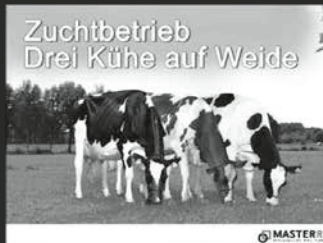
Zuchtbetrieb Drei Kühe auf Weide