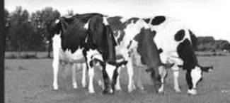
Zuchtbetrieb Drei Kühe auf Weide