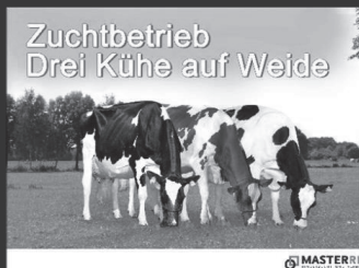
Zuchtbetrieb Drei Kühe auf Weide