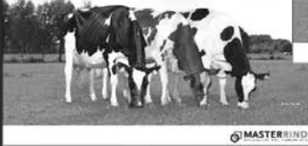
Zuchtbetrieb Drei Kühe auf Weide