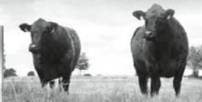
Zuchtbetrieb Familie Angus Bad Zwickramm