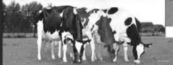
Zuchtbetrieb Drei Kühe auf Weide