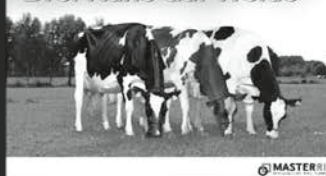
Zuchtbetrieb Drei Kühe auf Weide