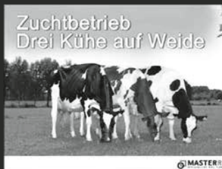
Zuchtbetrieb Drei Kühe auf Weide