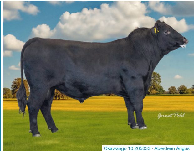
Okawango 10.205033 - Aberdeen Angus

Zwei Bullen – zwei klare Profile. Die passende Power für Ihre Herde.