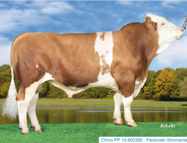
Chino PP 10.603395 - Fleckvieh-Simmental

Zwei Besamungsbullen – leistungsstark, klar profiliert, praxisorientiert.